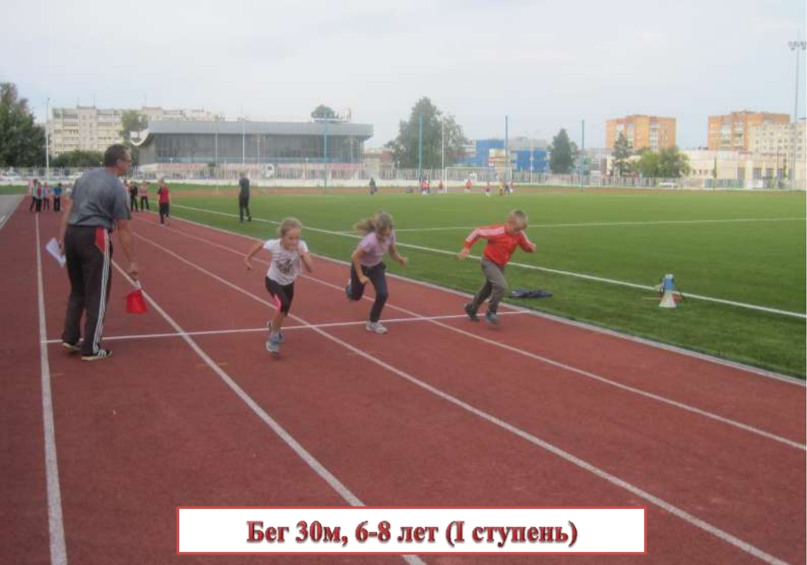
Бег 30м, 6-8 лет (I ступень)