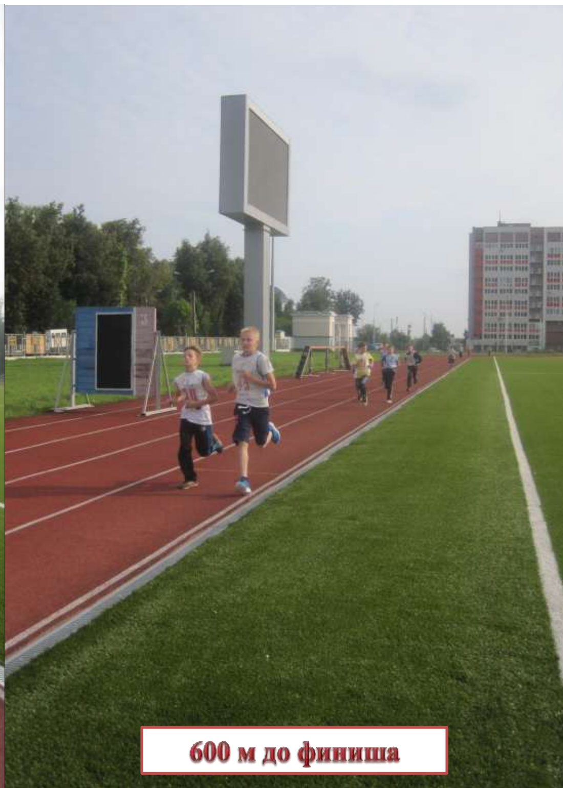
600 м до финиша