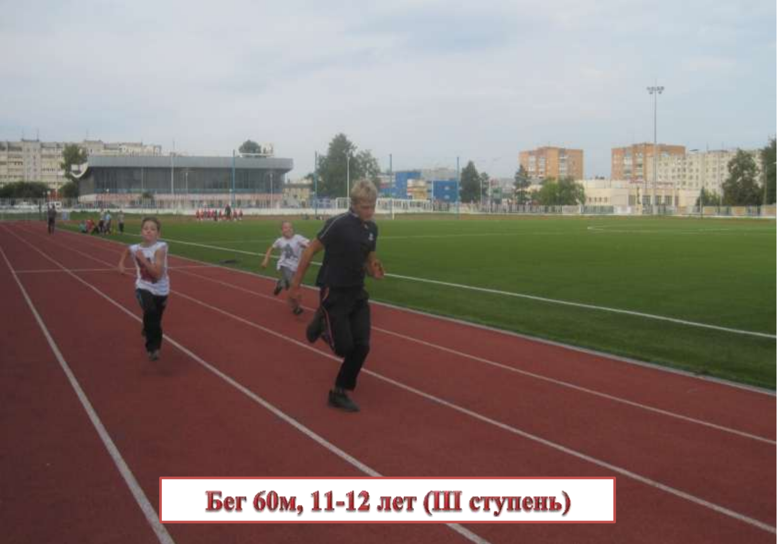
Бег 60м, 11-12 лет (III ступень)