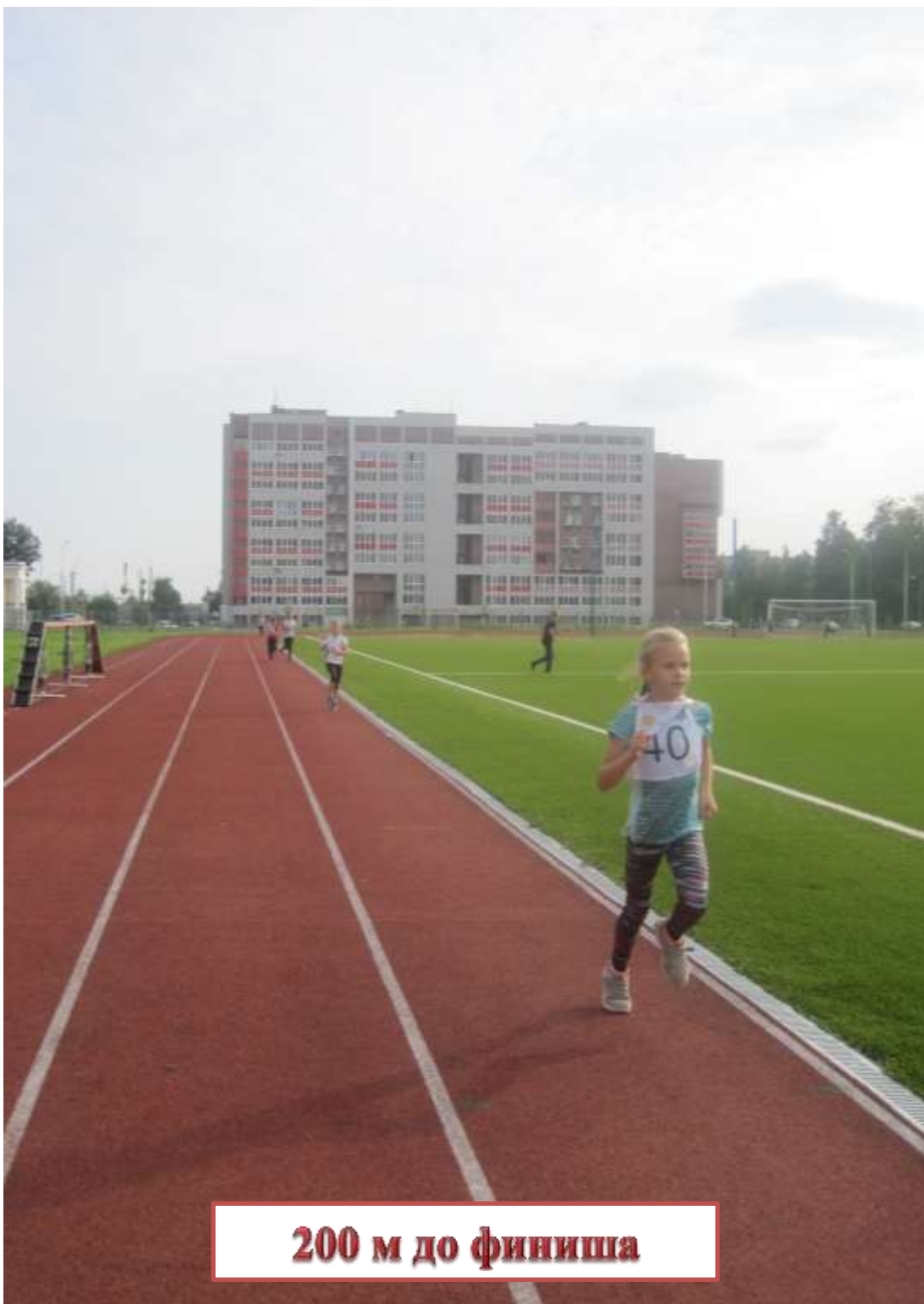
200 м до финиша