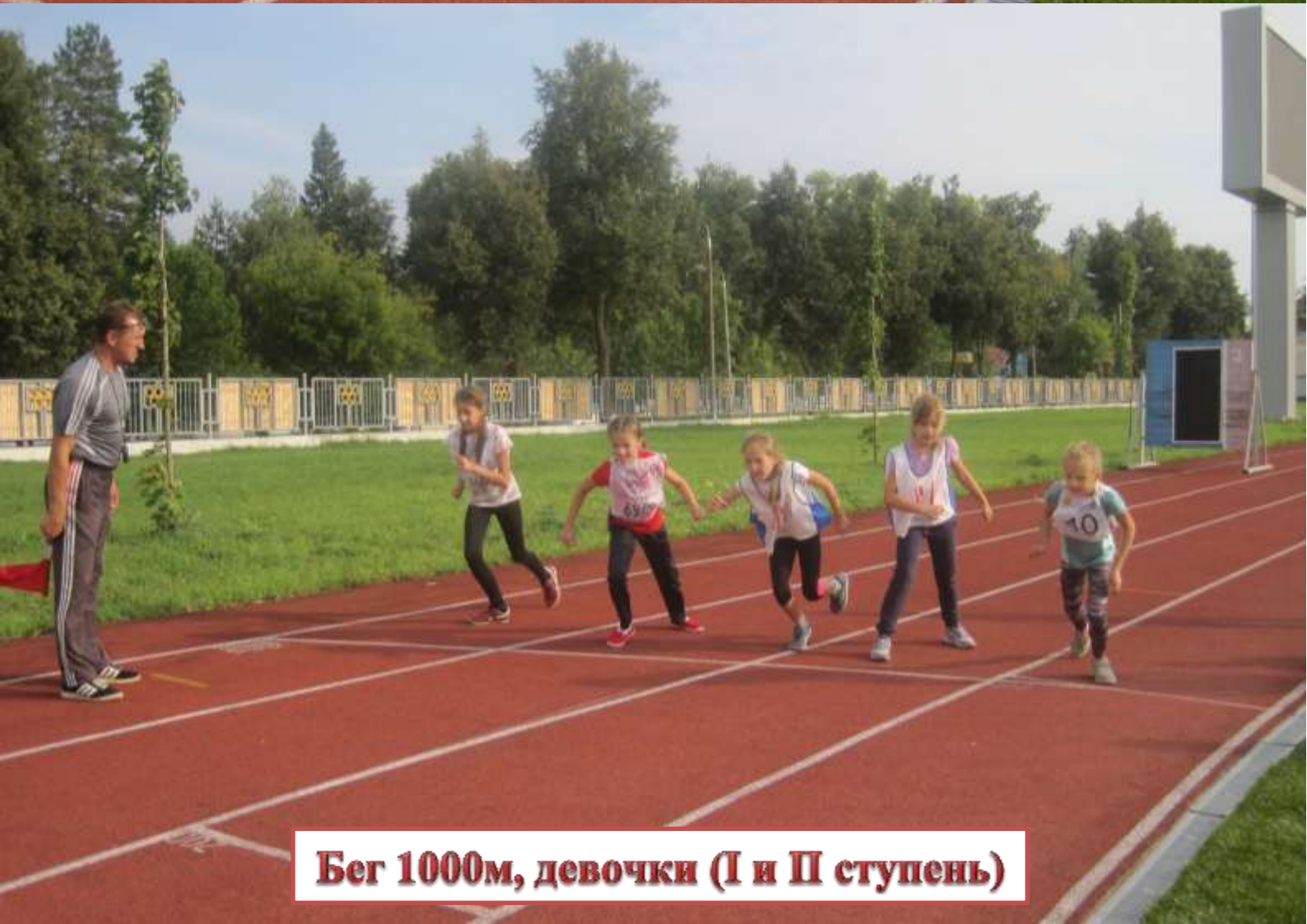
Бег 1000м, девочки (I и II ступень)