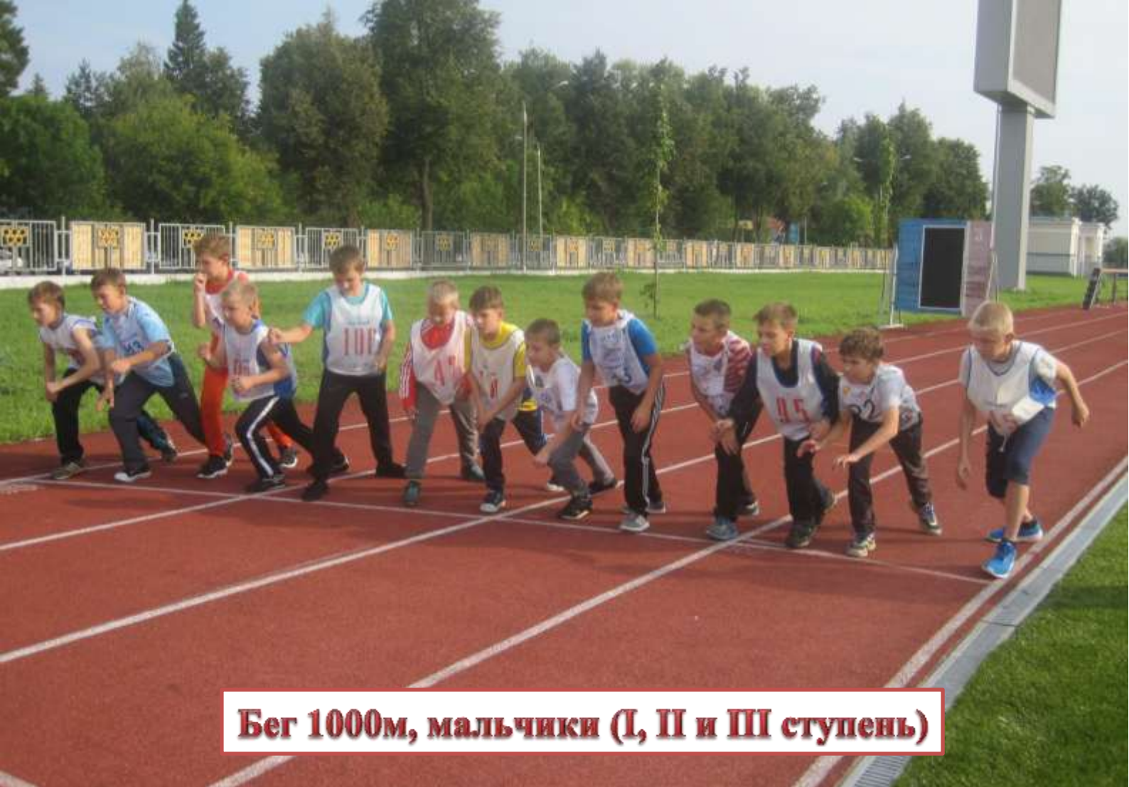
Бег 1000м, мальчики (I, II и III ступень)