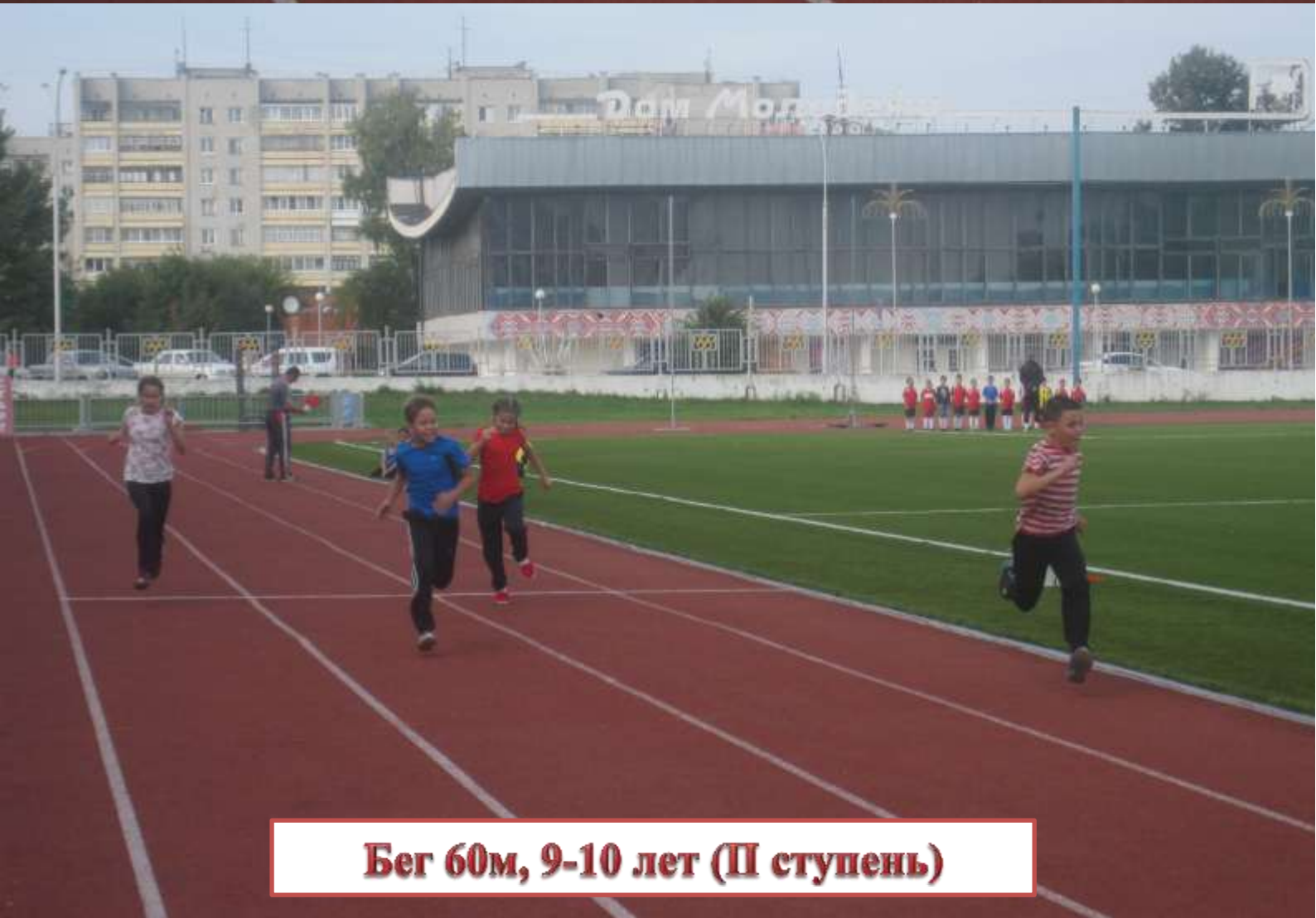
Бег 60м, 9-10 лет (III ступень)